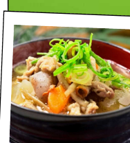
豚汁 (ねぎ乗せ放題)