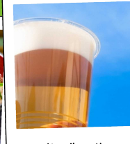
生ビール ソフトドリンク